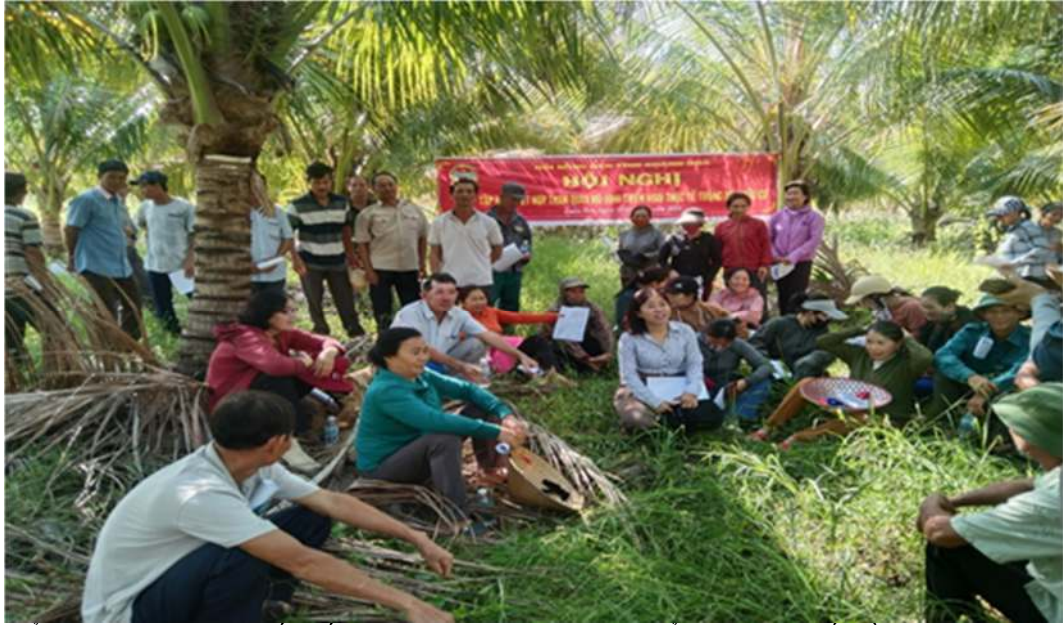
Ảnh: Hội nghị tập huấn kết hợp tham quan mô hình triển khai thực tế trồng dừa hữu cơ tại huyện Vạn Ninh, tỉnh Khánh Hòa