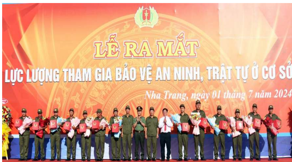
Ra mắt Lực lượng tham gia bảo vệ an ninh, trật tự ở cơ sở TP. Nha Trang

Từ những kết quả đạt được trong phong trào toàn dân bảo vệ ANTQ đã giúp khơi dậy sức mạnh, tiềm năng to lớn của nhân dân tham gia bảo vệ an ninh, trật tự, góp phần thực hiện thắng lợi các mục tiêu phát triển kinh tế - xã hội của tỉnh. Tuy nhiên bên cạnh những kết quả đạt được, phong trào toàn bảo vệ ANTQ ở một số nơi chưa được chú trọng cùng cố thường xuyên về chiều sâu; hệ thống chính trị ở cơ sở nhiều nơi còn yếu; một số cán bộ, đảng viên và một bộ phận nhân dân còn mơ hồ, chủ quan, mất cảnh giác trước âm mưu và hoạt động của “diễn biến hòa bình”, gây bạo loạn, lật đổ của các thế lực thù địch. Cấp ủy, chính quyền một số nơi chưa thực sự quan tâm đến công tác bảo vệ an ninh, trật tự, coi đó là trách nhiệm của lực lượng công an; một số ngành, địa phương chưa chú trọng đến yêu cầu đảm bảo an ninh quốc gia trong công tác phát triển kinh tế – xã hội... Điều đó đã ảnh hưởng đến sự vững mạnh của phong trào toàn dân bảo vệ ANTQ.