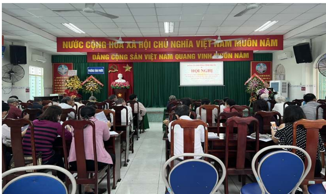
Đảng ủy phường Vĩnh Phước quán triệt Nghị quyết số 09-NQ/TW ngày 28/01/2022 của Bộ Chính trị về xây dựng, phát triển tỉnh Khánh Hòa đến năm 2030, tầm nhìn đến năm 2045

Vĩnh Phước là một phường biển nằm ở phía Bắc thành phố Nha Trang. Đông giáp biển Đông–phường Vĩnh Thọ, Tây giáp Núi Sạn– Phường Ngọc Hiệp, Nam giáp phường Vạn Thắng, Vạn Thạnh, Bắc giáp Phường Vĩnh Hải, tổng diện tích tự nhiên 172,16 ha, gồm 25 tổ dân phố với phường khoảng trên 5.600 hộ với hơn 26.500 nhân khẩu, có 03 nhà thờ (02 Công giáo và 01 Tin lành) và 10 chùa; 01 nơi thờ tự thuộc đạo Cao Đài.