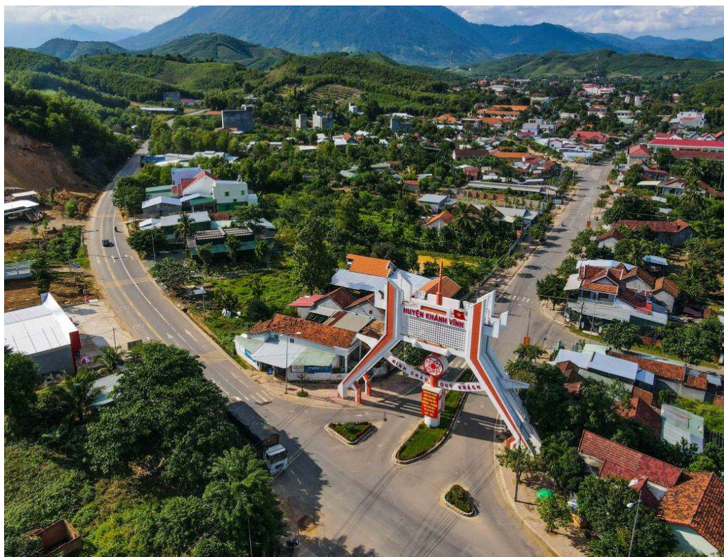
Trung tâm huyện Khánh Vĩnh.

C ông tác giảm nghèo bền vững là một chủ trương lớn, quan trọng, nhất quán, xuyên suốt trong quá trình thực hiện công cuộc đổi mới, xây dựng và phát triển đất nước. Điều này được thể hiện thông qua các chính sách, các chương trình hành động và các dự án hỗ trợ cho người nghèo. Việc thực hiện các chính sách này đã làm giảm bớt những rủi ro, nguy cơ đói nghèo cho người dân; giúp họ cải thiện đời sống vật chất, tinh thần; góp phần thu hẹp khoảng cách chênh lệch về mức sống giữa nông thôn và thành thị, giữa các vùng, các dân tộc và các nhóm dân cư ở từng địa phương trong cả nước và hướng đến mục tiêu tiến bộ, công bằng xã hội.