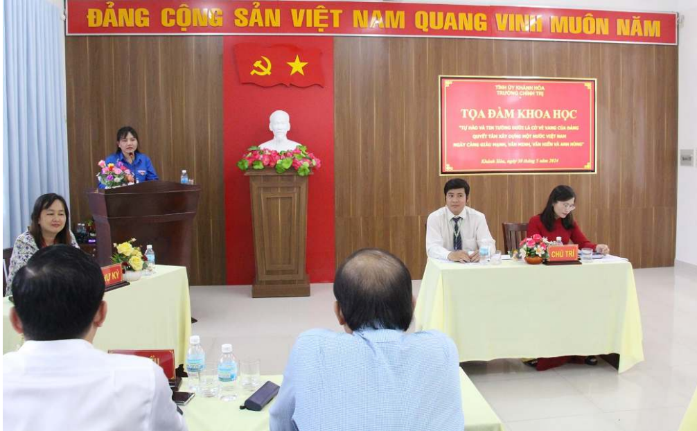
Trường Chính trị tỉnh Khánh Hòa tổ chức Tọa đàm “Tự hào và tin tưởng dưới lá cờ vẻ vang của Đảng, quyết tâm xây dựng một nước Việt Nam ngày càng giàu mạnh, văn minh, văn hiến và anh hùng” từ tác phẩm của Tổng Bí thư Nguyễn Phú Trọng