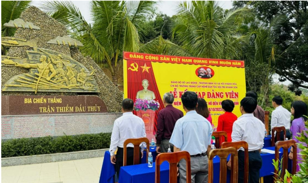
Kết nạp Đảng viên mới tại “Địa chỉ đỏ” Khu tưởng niệm Bia chiến thắng trận Thiêm Đầu Thủy (thị trấn Tô Hạp, huyện Khánh Sơn) của Đảng bộ Khối các cơ quan tỉnh Khánh Hòa